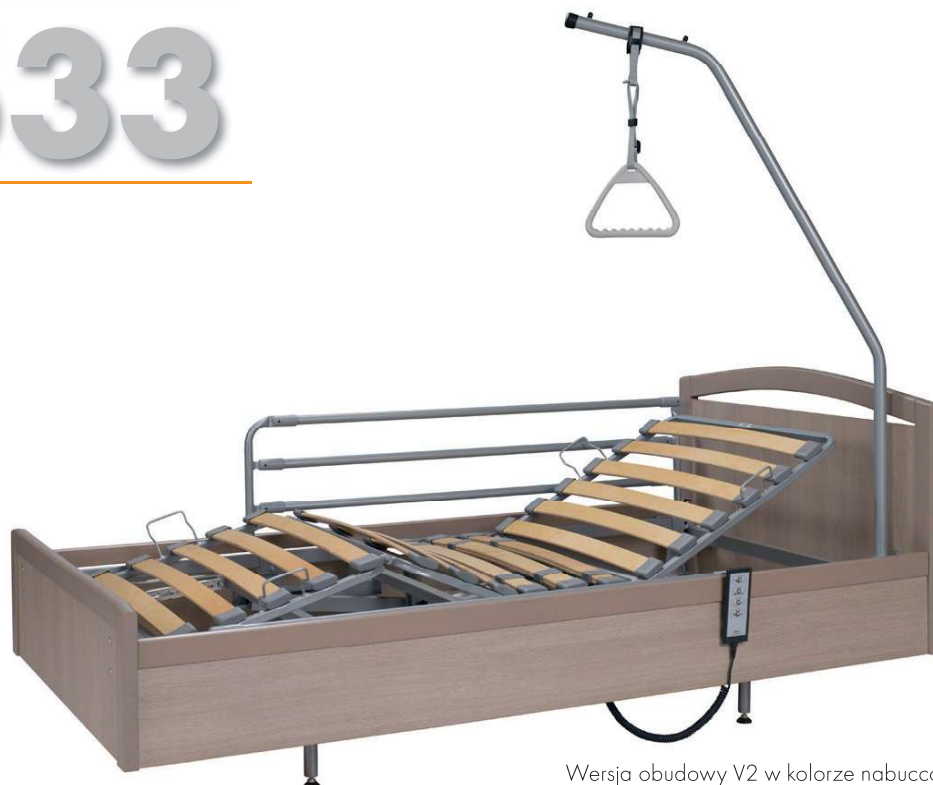
Wersja obudowy V2 w kolorze nabucco z barierką składaną